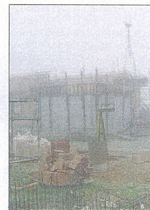
Les travaux devraient se terminer à l'automne 2010.

matériels » renchérit-elle. Nouveauté : les gendarmes pourront être logés dans l'enceinte de la gendarmerie, ce qui n'est pas le cas actuellement. Coût de l'opération : 1,5 million d'euros TTC environ tout compris (maîtrise d'œuvre, assu-