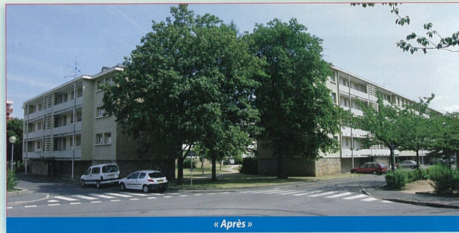
« Après »