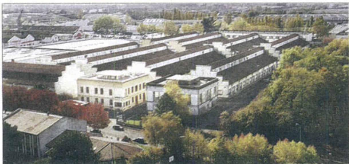
Une partie des bâtiments va être détruite (au centre), l'autre sera totalement rénovée (sur les côtés).

À l'époque, une délégation de syndicats et d'élus locaux avait rendu visite au ministre du Budget. Malgré cela le site a fermé en juillet 1993.