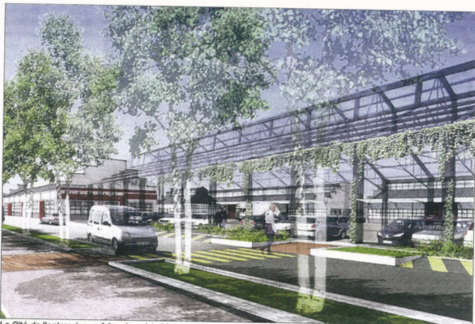
La Cité de l'entreprise va faire place à la friche industrielle de l'ex-Seita.