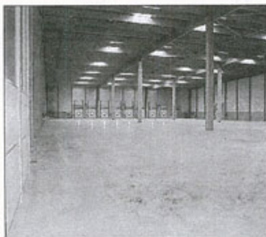
Le premier bâtiment de 42 000 m 2 héberge une seule entreprise actuellement.